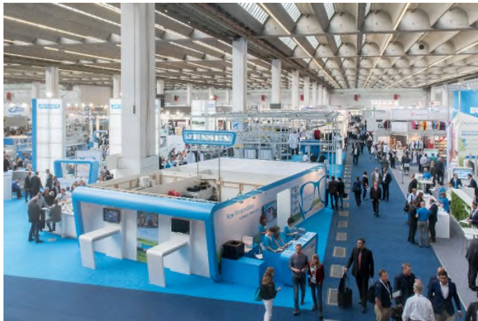
Texcare 2024 beleuchtet die Top-Themen Automatisierung, Kreislaufwirtschaft und Energieeffizienz sowie Hygiene.